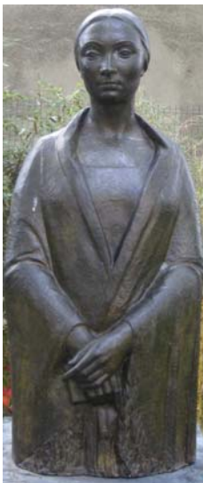
Raoul Lamourdedieu, "Jeune fille au châle", 1937, bronze, jardin des sculptures, musée Paul Belmondo, Boulogne-Billancourt