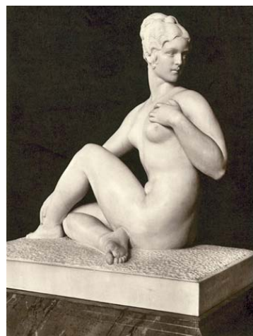
Raymond Delamarre , " Suzanne " ou " Nu de femme ", 1921, marbre (Premier envoi de Rome en 1921)