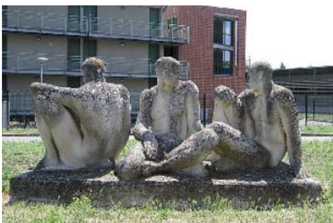
Eugène-Henri Duler , " Sans titre ", 1961, Lycée Déodat de Séverac, Toulouse