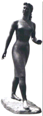
Paul Belmondo , " Femme en marche ", 1956-58, bronze, fonte de 2010 par la fonderie de Coubertin, Musée Paul Belmondo, Boulogne - Billancourt