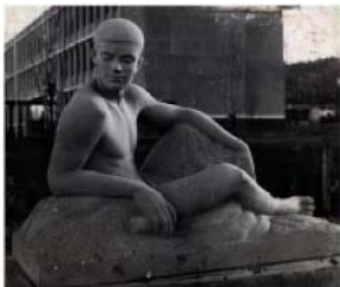
Jean Druille , " Sans titre ", 1960, Lycée Bellevue, Toulouse