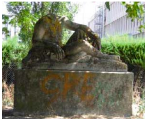
Jean Druille , " Sans titre ", 1960, Lycée Bellevue, Toulouse