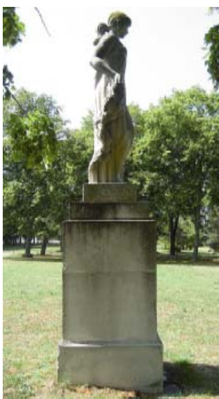
Ulysse Gemigniani , " Sans titre ", 1955, Lycée Bellevue, Toulouse