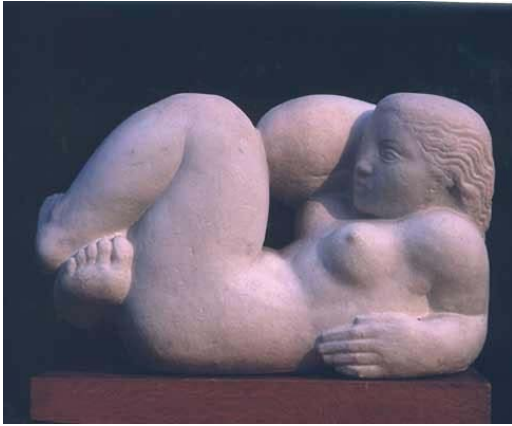
Paul Letourneur , " Femme-Enfant ", marbre rose de Milan, 1950, 32 x 51.5 x 19.5 cm