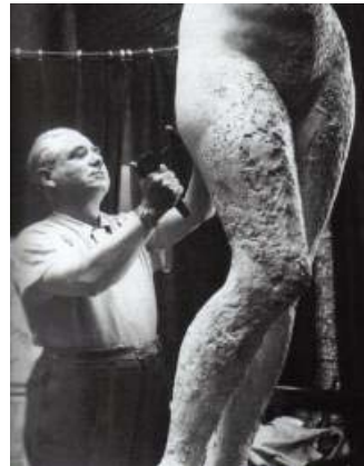
Alfred-Auguste Janniot , Étude pour une statue destinée à la Bibliothèque Nationale