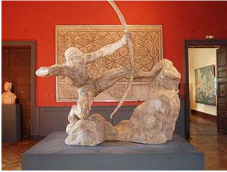
Bourdelle , " Héraklès archer ", plâtre, musée Ingres, Montauban, © Base Joconde