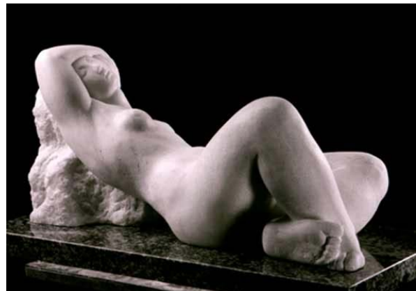
Paul Letourneur, "Le Rêve", marbre rose de Milan, 1976, 22.5 x 48 x 24.5 cm