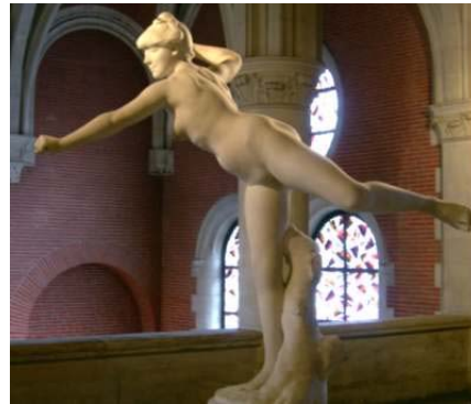
Falguière, "Nymphe chasserresse", 1888, Musée des Augustins, Toulouse