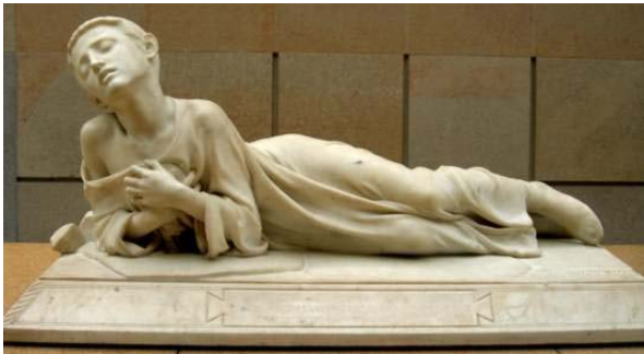
Falguière, "Tarcisus", 1868, Musée d'Orsay, Paris