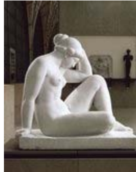
Aristide Maillol , " Méditerranée dit aussi La Pensée ", entre 1923 et 1927, marbre, H. 110,5 ; L. 117,5 ; P. 68,5 cm