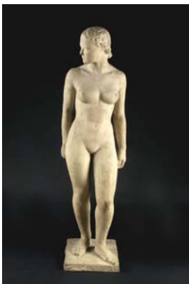
Charles Despiau , " Assia ", terre cuite, 1937, 86 x 25 x 20 cm