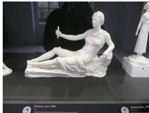
Paul Belmondo , " Pomone ", vers 1950, plâtre