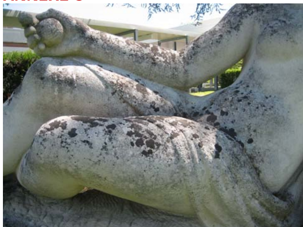
Paul Bemondo, détail