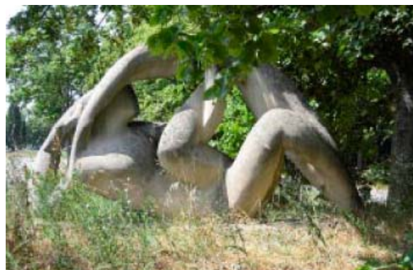
René Collamarini , " Athlète ou Acrobates ", 1960, Lycée Bellevue, Toulouse