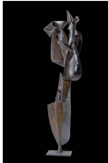
Arthur Saura , " L'arpège ", métal 177x43 cm, Collection particulière