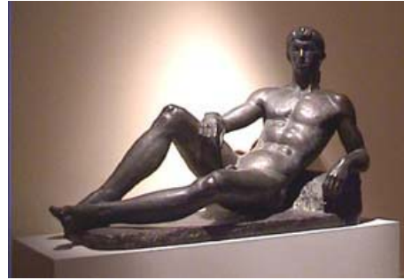
Paul Belmondo, "Apollon au repos ou Jeune Éphèbe", 1956-1958, bronze, Susse fondeur