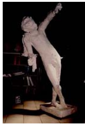
Auguste Rodin , " Le Génie du Repos Eternel " plâtre original, 201 cm, dernier état musée Rodin, Paris