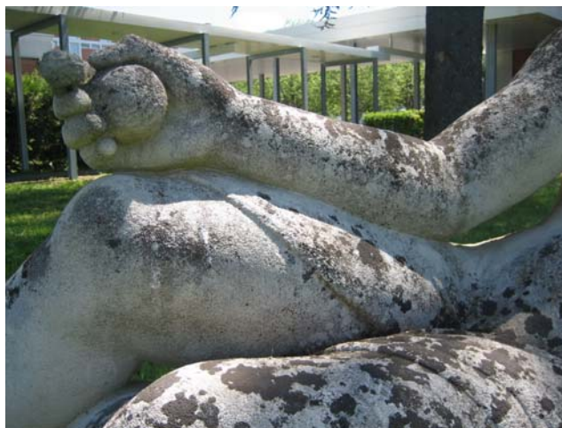
Paul Bemondo, détail