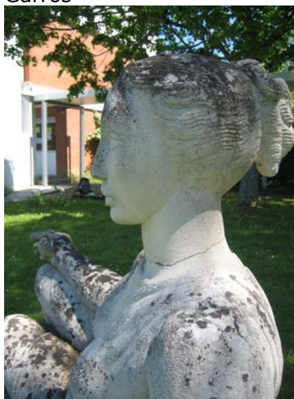
Paul Belmondo, détail